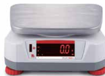
Display posteriore con sensore touchless integrato