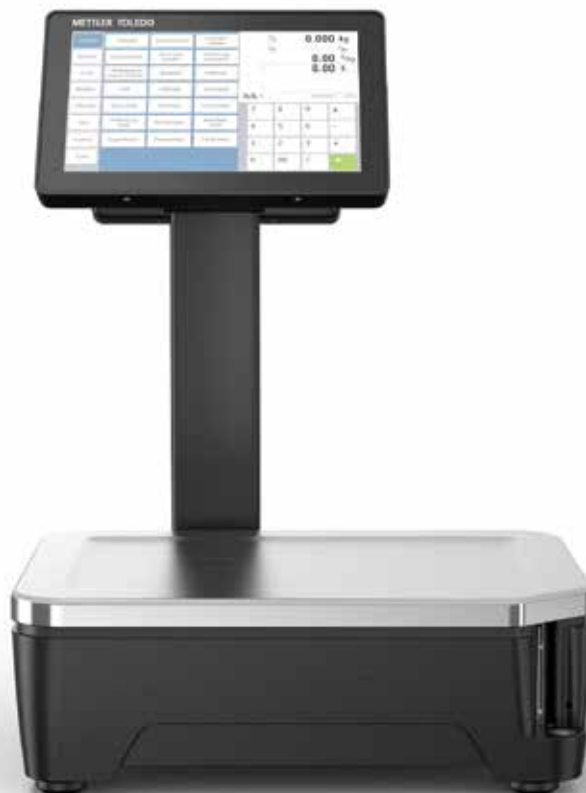
Bilancia FreshBase Tower

Funzionalità comprovata, rapporto qualità/prezzo eccezionale: FreshBase Line è la nuova gamma di bilance per i dettaglianti che vogliono prestazioni ottimali e tutto il comfort di una bilancia touchscreen.